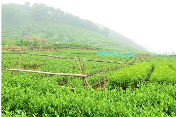
冰的小雨 梅家坞的茶山