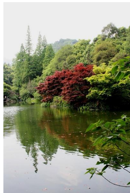
crystal 九溪烟树景色依旧，色彩却没有冬天来的浓烈。