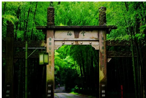
炫影流年 云栖竹径

🚌 交通：K4、K504、K822、822、Y1、Y2、Y3、假日5、7线净慈寺站。