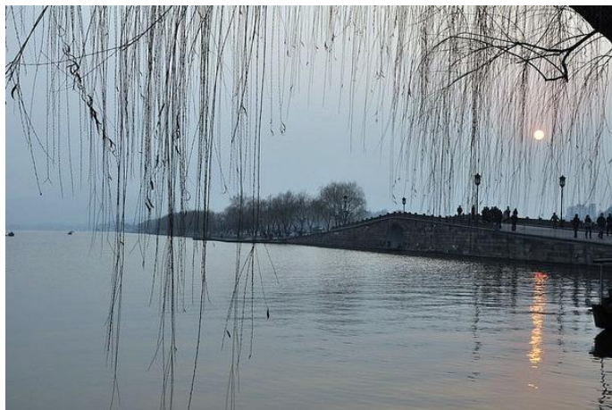
📷 竹影桃花 断桥