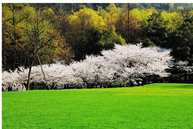
阿滋猫 太子湾公园