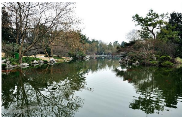
📷 稻禾 花港观鱼。

看点： 每逢仲秋时，皓月当空，水天相映，塔中点燃灯烛，与明月上下争辉。赏月游湖者摇桨前来，搅动满湖银辉，天月，水月，塔月，心中之月，融为无限的悠思和寄托，怡然忘归。