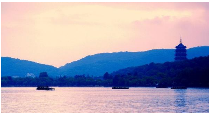
炫影流年 雷峰夕照