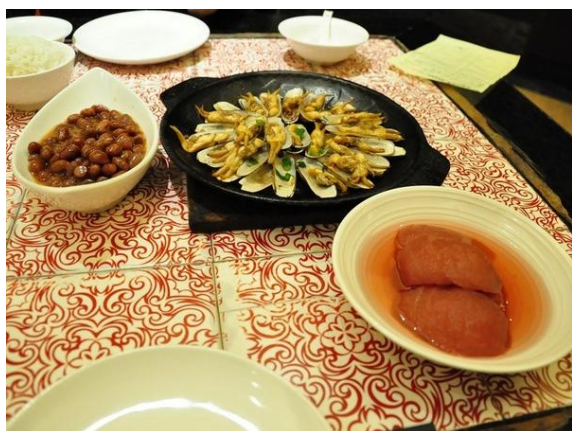
woody 晚上去白鹿吃的饭，挺有特色，价格实惠

交通信息：8, 35, 38, 49, 68, 106, 113, 208, 251, 270, 290, 305, k206, k216, k270, k305, k305大站车, k35, k38, k49井亭桥站。