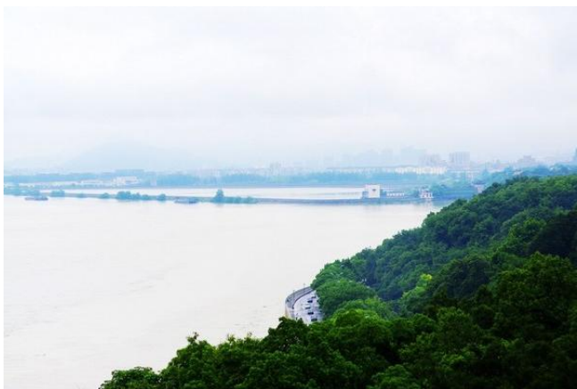
炫影流年 六和塔远眺

摄影指南： 从六和塔身后北侧往山上走，越过塔苑，来到仿造应县木塔的台地，蓦然回首，六和塔和钱塘江大桥的雄姿尽现眼前，你会发现你已经站在最满意的拍摄点上了。