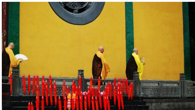
格格wu 他们刚下晚课，让我目睹了师傅们的风采。

兮然这样说： 天竺和灵隐寺在同一座山，之前的几次去杭州每次都会去灵隐烧香，其实杭州本地人烧香多选择的是上天竺；如雷贯耳的灵隐更多的接待的是外地游客和生意人。