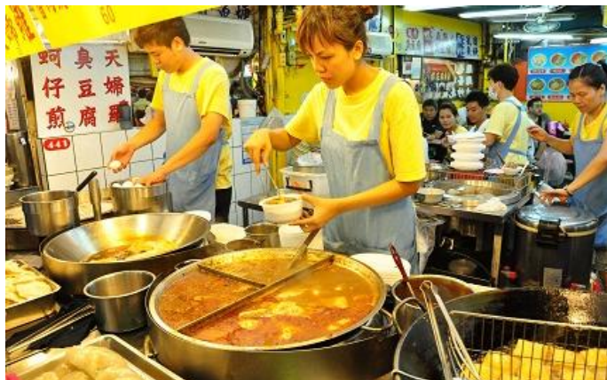
By: PEPSI最爱海泥根 一片热腾腾的景象

简妮行天下 点评：台北当然不能错过最著名的士林夜市，捷运淡水回来很顺路，吃了大肠包小肠，大饼包小饼。。。不过说实话，台湾的小吃没有想象中那么好吃，大概口味不同，我们团里好几个人都这么认为，相对还是香港澳门的小吃美味！