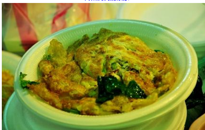
士林夜市里著名的蚵仔煎