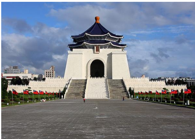
By: 刘东南 中正纪念堂

中正纪念堂是台北最宏伟的纪念性建筑，占地25公顷，座落着中正纪念堂、中正公园、牌楼、围墙、瞻仰大道、“国家剧院”、音乐厅，是台北市最重要的大型活动广场、文艺表演中心。位于中山南路上的正牌楼，上有“自由广场”四个大字。陈水扁当政时，将牌楼上原有的“大中至正”四字改为“自由广场”。蒋介石名字“中正”的含义，就是“大中至正”。牌楼高30米、宽80米，距纪念堂中心线470米。由此远望纪念堂，气势雄伟。纪念堂还有两座侧牌楼，在爱国东路的为“大孝门”，在信义路的为“大忠门”。纪念堂于1976年10月31日蒋介石九十诞辰破土动工，1980年3月31日竣工。