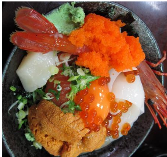
By: Cheer* 淇 十分饱满的鲑鱼卵

参观完龙山寺，前往华西街观光夜市，又是一个美味的夜晚。华西街观光夜市是台湾首座观光夜市，入口处有一座传统中式牌楼，街道挂着红色灯笼，相当具有乡土特色，主要以台湾各种山产野味及海鲜料理为主。而且还有一些杀蛇及逗蛇的表演，也值得一看。