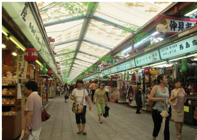
浅草寺的商品一条街