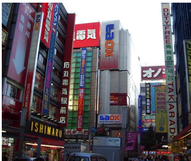
秋叶原

电器店里琳琅满目的商品。不过比国内价格差不了许多。倒是日文操作菜单的产品有明显的价格优势。英文和中文菜单的算国际款型所以不便宜，这是他们的经营之道。一般大的店都有中国留学生在那里打工，所以你不用发愁说不明白，只要注意找到她们。