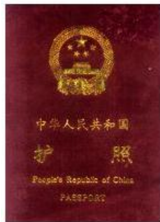
中国公民因私护照