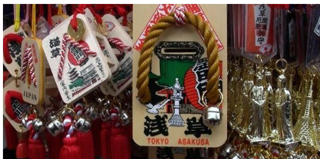
By：青龙偃月 漂亮的浅草雷门纪念品

从雷门到宝藏门是一段石头铺的路，为参拜观音的必经之路，这就是著名的“仲见世”街，是东京最热闹的购物街之一，游客来自世界各地。约300米的街两旁挤满了100多家店铺，出售供神用品、江户玩具、舞蹈服装、和服、和式浴衣、不倒翁、扇子，还有东京名点小吃雷米花糖、人形烧、炸糕、煎饼、丸子。据说这些店铺中许多是百年老店，久负盛名。“人形烧”，是浅草最有名的点心。