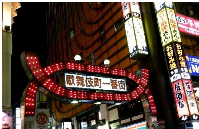
By：青龙偃月 歌舞伎町

歌舞伎町在日本也是黑帮最集中的地方，黑社会在这一带的事务所约有120处，在这一带的事务所约有120处，黑社会成员达1000多人。日本的黑社会是全世界唯一被它的政府默认的。