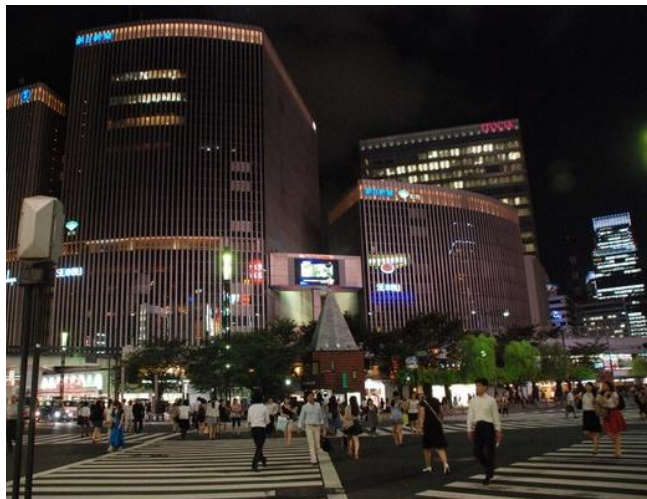
银座的三角斑马线

青龙偃月点评： 博物馆是日本唯一一家创下吉尼斯世界纪录的大型玩具店，整整4层楼的商店，共有5万种商品，保证你有的看、有的玩，还能满载而归。