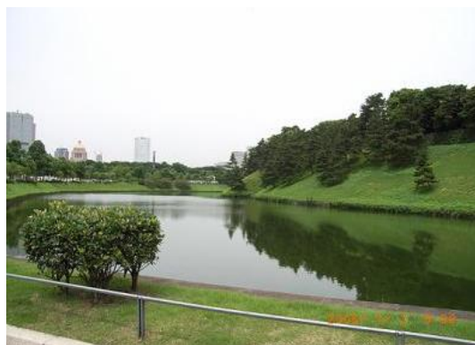
岸的一边是市区，一边是天皇住居