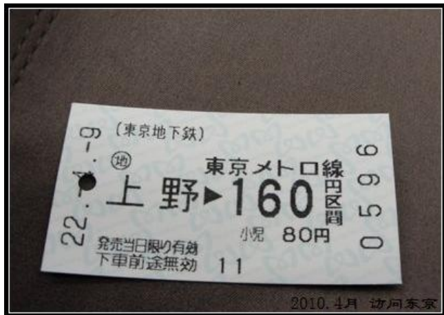
By: 乖巧的恶魔 东京地铁票

lzg提示： 日本的交通主要是轨道方式，不管是东京市内还是近郊或是去其他城市。一般都可以到达。所以如果您要在日本停留3天以上的话，建议一下飞机在成田机场办个定值或可充值的乘车卡，方便的很。