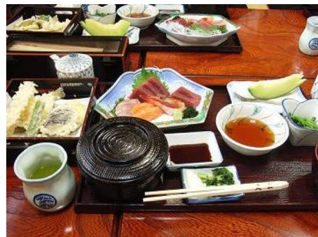
By : breeze