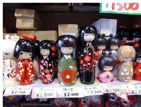
By : allul