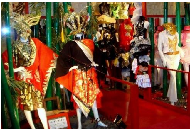
By : 青龙偃月 原宿一些舞会派对的服饰

在原宿的代代木公园，每周六的下午便成为了年轻人的自由天地，奇装异服、超想像力怪异的头发、奇异的妆容构成了时尚的秀场，给人们带来了许多灵感。就像是看一场新新人类的大PARTY，尽情地唱歌、跳舞、豪吃。