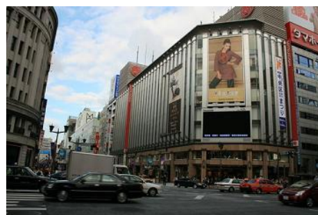
By : 哈哈豆

一个是银座，这里有最为集中的奢侈品专卖店，而且规模全部都很很大，这里的地价为日本之最，也是东京的商业中心区。