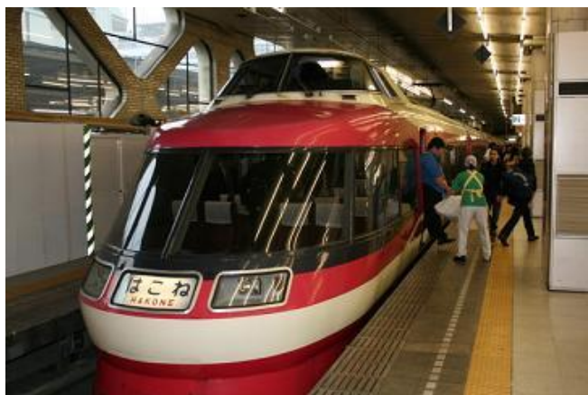
By: 哈哈豆 乘上回往东京的列车

长途巴士： 在日本长途巴士一般都是傍晚出发早上到达，费用又比飞机和新干线便宜，座位是可调整任意角度的活动软座，因此十分舒适。从东京乘坐长途公共汽车可以直达青森、秋田、仙台、新潟、长野、名古屋、金泽、京都、大阪、奈良、神户、广岛、博多等城市和地区。