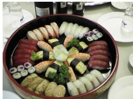
By : 日出