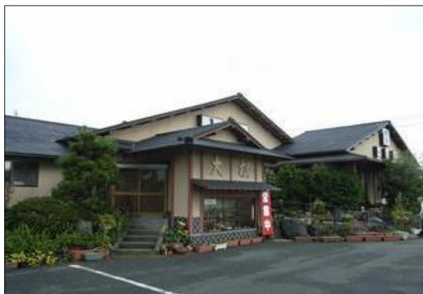
By : breeze