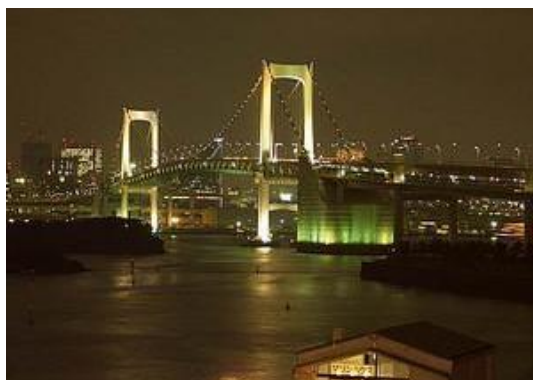
台场附近的彩虹大桥挺好看的