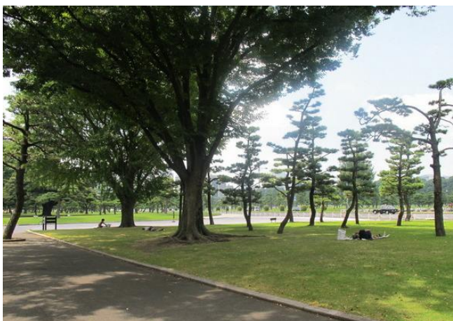
By : melodyzee 街心公园

melodyzee点评： 东京的街道都很干净，在非上下班高峰期人很少，很安静。街边像这种喷泉、街心公园很多，很清爽的感觉。在东京街头看到“中国银行”，自豪！！